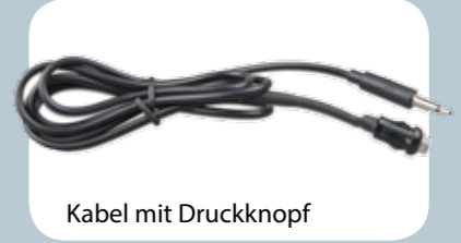
Kabel mit Druckknopf